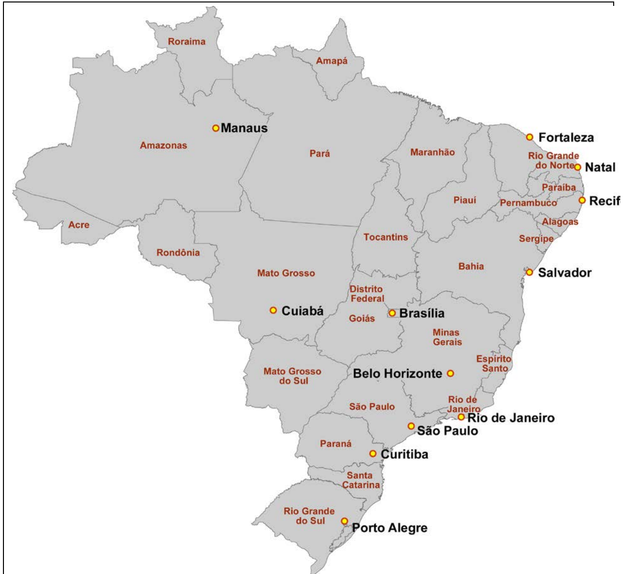
Fig. 1 -. Emplacements des stades où vont se jouer les matchs de la coupe du monde de football 2014 et Etats du Brésil